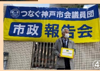
ワクライナ募金を呼びかける