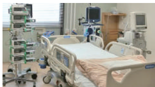
中央市民病院内のコロナ専門病棟

4年前の選挙の時には想像もつかなかった新型コロナウイルス感染症の拡大。私は市民や医療・介護の現場からの声を聴き、市政に提言して実現をしてきました。