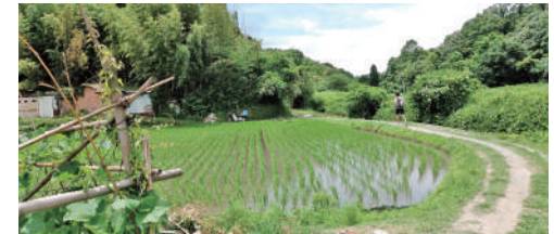
多井畑西地区に残る水田