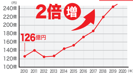
明石市【予算】こども部門 ※明石市資料より