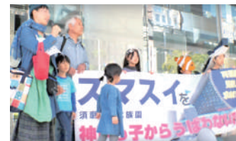
スマスイを神戸っ子から奪わないで! パレードに参加